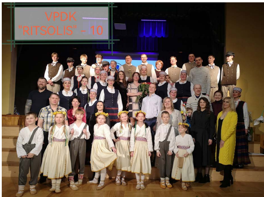
VPKD "Ritsolis" esošie un bijušie kolektīva dalībnieki

Kolektīvā satikušies dažādu profesiju un raksturu cilvēki, kuri pēc darba dienas atrod laiku savam priekam – dejai. Kādam dejošana ir viņa dzīves sapņa piepildījums, kādam patīk izrauties no ikdienas un atrasties uz skatuves, kādu ir sieva piespiedusi un tas nekas, ka jau 30 gadu pieredze, dejojot no bērnības, jo dzinējspēks ir kustībā – gadi iet uz priekšu – jākustās. Pavisam kopā "Ritsoli" ir dejujuši 46 dalībnieki, un ja pieskaita jaunus dejojājus, tad