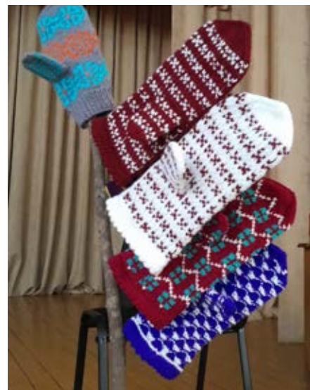
Zeltītes Lazdiņas cimdi

Latvijas jubilejai tuvojoties, gribas aicināt aizdomāties: kas/kur ir Tavs spēka avots? To vieglāk ir sajust, izspēlējot situāciju: ja paliktu slikti ar veselību, neviena nebūtu mājās, nevienu nevarētu sazvānīt..., kam lūgtu palīdzību?... un, ja nu būtu iespēja piezvanīt, kuram cilvēkam Tu zvanītu vispirms?... (ja viņš/-a neatbildētu, kuram zvanītu kā nākamajam?... un nākamajam?... ) ... kad ir atbildēts, pievērs uzmanību, vai viņš/-a/-i ir Tavas ģimenes/dzimtas cilvēks/-i? Abas